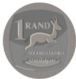
ZAR – ראנד דרום אפריקני