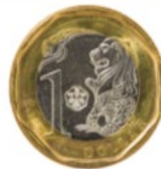
SGD – דולר סינגפורי